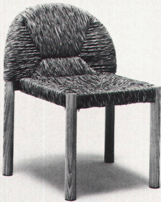
Design: Pajetta, Chiozzi