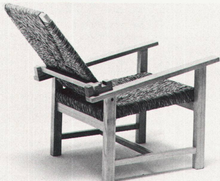
Design: Lomazzi, De Pas, D'Urbino