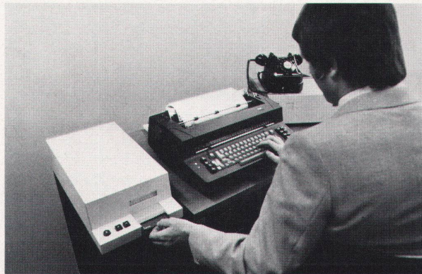
Das ist die Einrichtung, die Sie brauchen, um Computerleistung direkt am Arbeitsplatz zu erhalten: das Terminal IBM CMC (oder ein anderes Terminal), Modem und Telefon. Das Spezielle am Terminal IBM CMC ist, dass es sich zusätzlich als Magnetkartenschreibmaschine einsetzen lässt.

Viele Probleme lassen sich nun mit einem oder mehreren der über 600 CALL Anwendungsprogramme lösen. Diese sind verfügbar für den betriebswirtschaftlich-kommerziellen Bereich, für Mathematik, Technik und Planungsverfahren. Ausserdem ist es möglich, spezielle Programme für spezielle Probleme zu entwickeln: in den Sprachen BASIC, FORTRAN oder PL/1 sind sie sehr einfach und rasch zu formulieren.