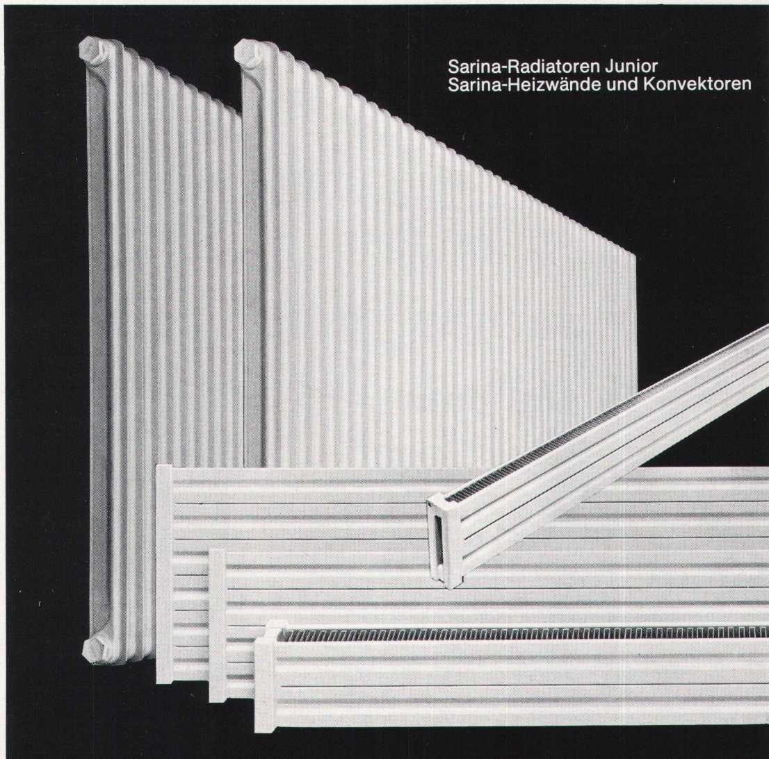
Sarina-Radiatoren Junior Sarina-Heizwände und Konvektoren

Verlangen Sie unser Prospektmaterial oder unseren Vertreterbesuch.