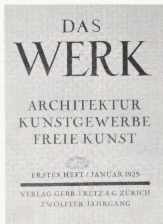
Numéro de janvier 1925 Januarheft 1925

punkt der «alten Garde». Letztere will die Rechtmässigkeit ihres korporativen Vorrangs untermauern. Vielleicht handelt es sich um eine Selbstverteidigung gegen den Einbruch in das Gebiet der Berufsaus-