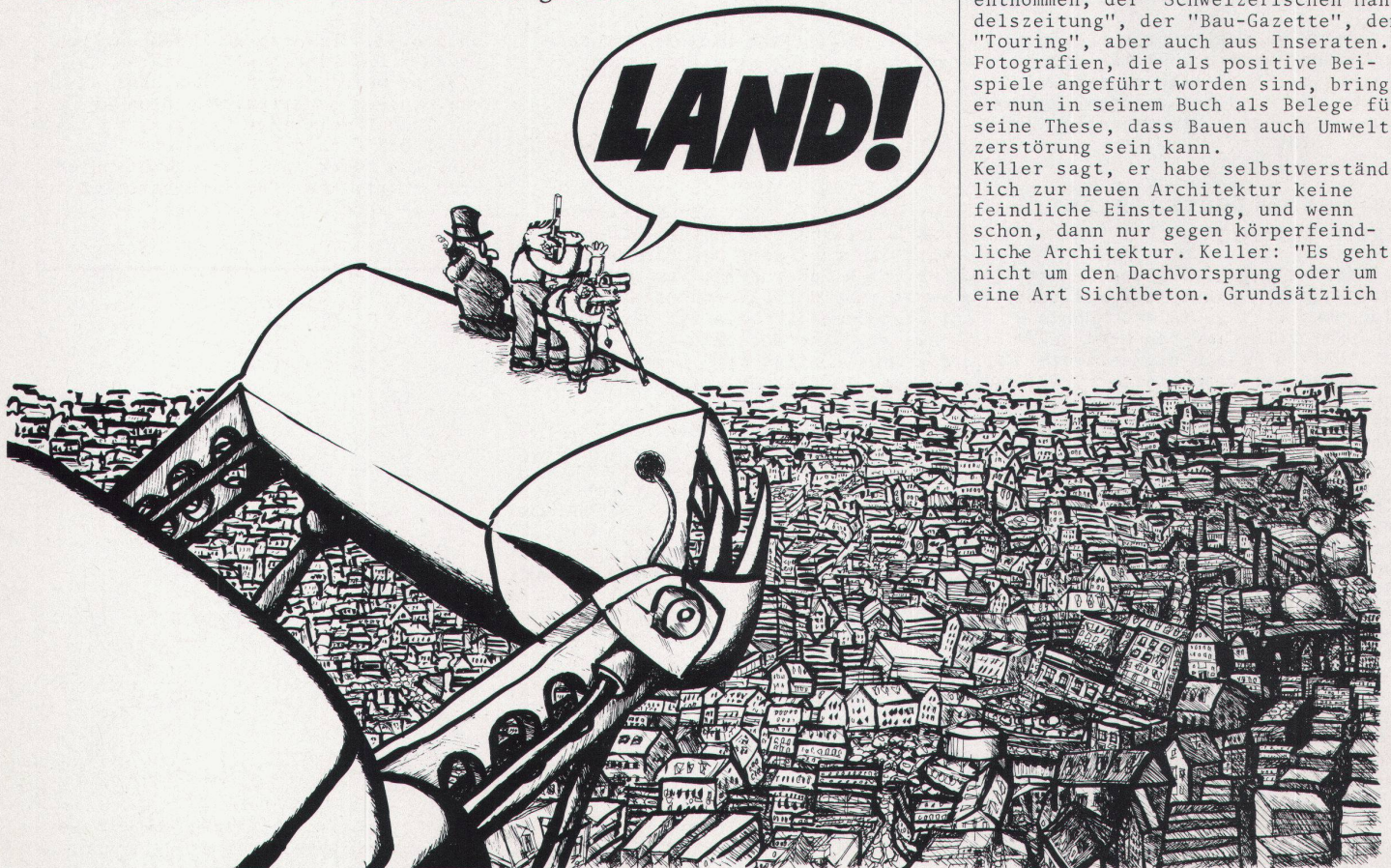
Wie der Zürcher Maler Ueli Bär das Chaos der Agglomeration sieht

Keller sagt, er habe selbstverständlich zur neuen Architektur keine feindliche Einstellung, und wenn schon, dann nur gegen körperfeindliche Architektur. Keller: "Es geht nicht um den Dachvorsprung oder um eine Art Sichtbeton. Grundsätzlich