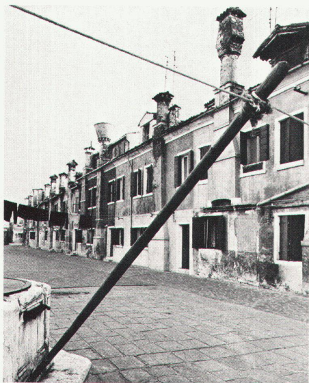
Giudecca, Corte delle Funi; Beispiel der Entwertung und des fortgeschrittenen Zerfalls von Reihenhäusern des sozialen Wohnungsbaus.

oder der Öffentlichkeit zur Verfügung stehenden Liegenschaften;