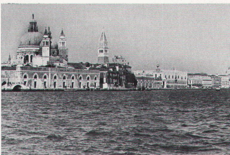
Ansicht des Gebietes Zattere ai Saloni. Der Hallenbau links war zuerst von der Gemeinde für Sporttätigkeiten bestimmt. Jetzt gehört er zu den städtischen Einrichtungen für künstlerische Veranstaltungen.

Im ganzen gesehen weisen die aufgeführten Zahlen auf eine deutliche Verflachung der Beschäftigungslage in der venezianischen Baubranche hin, wobei anzunehmen ist, dass diese Verflachung durch die Liegenschaftsspekulationen der Bauunternehmer selber noch gefördert worden ist. Ein Vergleich der Zahlen des Liegenschaftsbesitzes mit dem Ergebnis der Industriezählung von 1971 beweist, dass die Personalunion von Spekulant und Bauunternehmer Tatsache ist. Zahlreiche Bauunternehmer, die Betrieben mit über 50 Beschäftigten vorstehen,