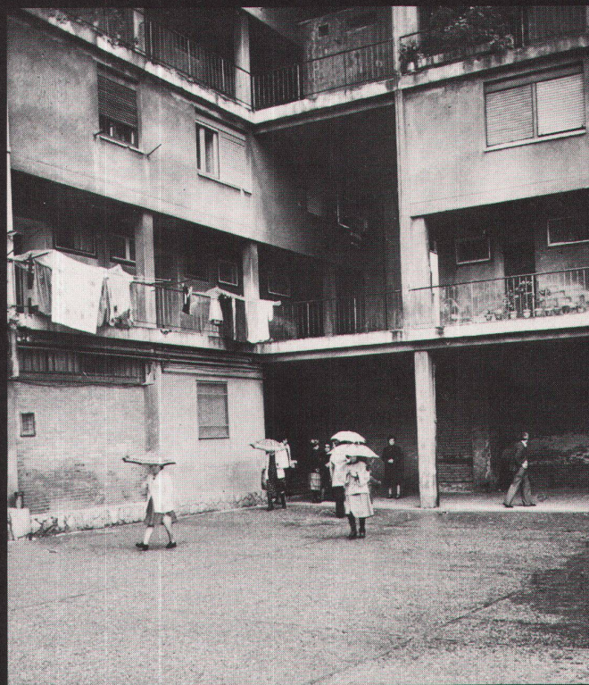
J.L. Sert, J. Torres-Clavé: Sozialwohnungsbau «Casa Bloc» (1932–36)/habitations sociales «Casa Bloc» (1932–36)