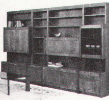
221/342 Wohnwand-Kombination Eiche, Farbe rustikal Scheiter-Bar mit Licht, Rauchglasfenster Lieferpreis: 4417.- Abholpreis: 4065.-