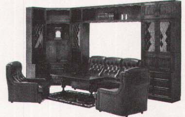
713/ Wohnwand-Programm «Dudor» für Wohn-, Ess- und Arbeitszimmer Eiche massiv, antik behandelt. Wie Bild. Lieferpreis: 8405.- Abholpreis: 7805.-