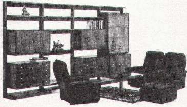
712/ Wohnwand-Programm «brasilia» Eiche/Eiche, kavatna- oder brasilianisch Überlappende Variationsmöglichkeiten, z.B. wie Bild. Lieferpreis: 3077.- Abholpreis: 6511.-

Möbel-Pfister, damit Sie aus Zimmern ein Zuhause machen können.