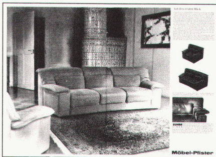
4 SUHRA-Linea-Klubsessel-Sortiment (Möbel-Pfister-Insertat im Tages Anzeiger Magazin Nr.42/1978)/SUHRA-Linea Collection de fauteuils (Annonce dans le Tages Anzeiger Magazin No 42/1978).

«Nach dem Essen nimmt man die Gläser mit ins Wohnzimmer. Man lauscht der Stille und später einer Platte, als höre man beides zum erstenmal. Endlich findet man Zeit, in dem Buch zu lesen, das