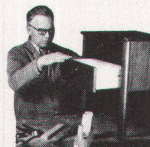
Möbel-Pfister liefert alles, was Sie gekauft haben und nicht gleich mit- nehmen wollen oder können, auf einem vereinbarten Termin nach Haus. Zu den drei Mann einer Liefer Equipe gehört immer ein Schweizer, der bei Ihnen zu Hause dafür sorgt, dass Ihre Möbel so montiert werden und funktionieren wie die Möbel, die Sie gekauft haben.