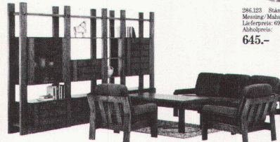
221.455 Element-Wohnwand Echt Eiche/Dekor. Farbe rustikal Bücherstift-Schieber Lieferpreis: 2205.- Abholpreis: 1985.-