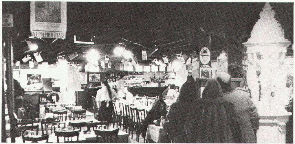
126 Paris. Le Lucernaire.

Seit Juni 1977 nach nur 15monatiger Bauzeit eröffnet, ist heute das Lucernaire trotz anhaltendem Erfolg in grossen finanziellen Schwierigkeiten. Schriftsteller Eugène Ionesco ruft die Öffentlichkeit zur Rettung auf und schreibt in seinem offenen Brief vom 22. Januar 1979 an Kulturminister Jean-Philippe Lecat: «...ich habe das Lucernaire also besucht; wirklich ein aussergewöhnlicher Ort. Publikum aus allen Gesellschaftsschichten findet sich da ein, ein Ort der Volksbegegnung im besten