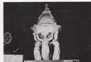
125a-h Paris. Le Lucernaire; Impressionen. / Paris. Le Lucernaire; impressions.