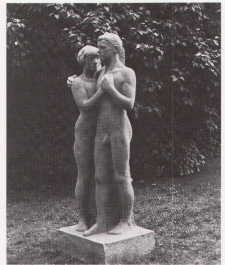
Otto Roos: Zwei Menschen, 1916. Sandstein, Kunstmuseum Basel