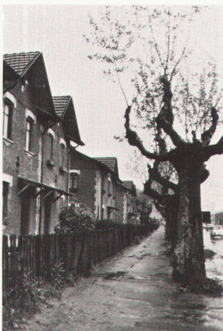
2 Häuser für Arbeiter und Angestellte