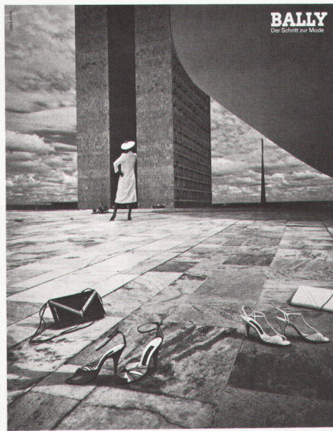
Machen Sie eine Entdeckung in die Kleiderjahre. Die neuen Schuhe sind die mit schmalen Absätzen und raffiniert geformtem Bridenschuh.