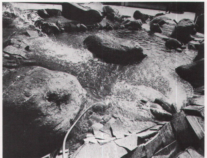
1-6 Edy Brunners Arbeit vor dem Vita- Gebäude