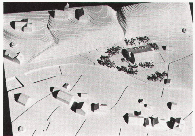
1. Preis, Turnhalle Stein/Toggenburg