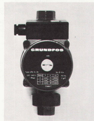
2 Kleinumwälzpumpe Grundfos UPS 15

Der speziell für diese Pumpe von Grundfos entwickelte und gebaute Spaltrahmotor ist blockierungsfest. Ein Schutzschalter ist dafür nur erforderlich, wenn vom EW vorgeschrieben. Das besonders hohe Anlaufmoment des Motors sichert in jeder Drehzahl einen störungsfreien Betrieb der Pumpe. Die Funkenstörung entspricht dem Funkenstörungsgrad N. Eine verbesserte Klemmverbindung erleichtert den Anschluss an das Stromnetz.