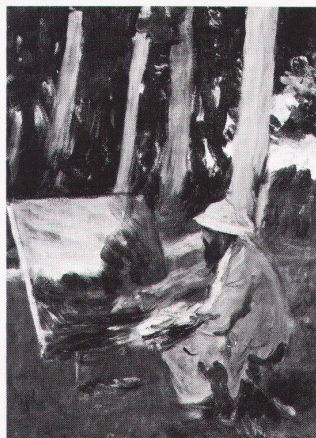
John Singer Sargent: Claude Monet Painting at the Edge of a Wood