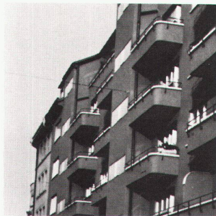
Mit Miracote sanierte Balkone in Zürich.