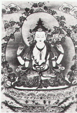
Thangkas – tibetische Rollbilder

Museum für Ostasiatische Kunst Köln Meisterwerke ostasiatischer Kunst – Malerei, Plastik, Kunsthandwerk aus China, Korea und Japan bis 31.12. Sagemono – der Gürtelschmuck der Japaner bis 2.1.1983