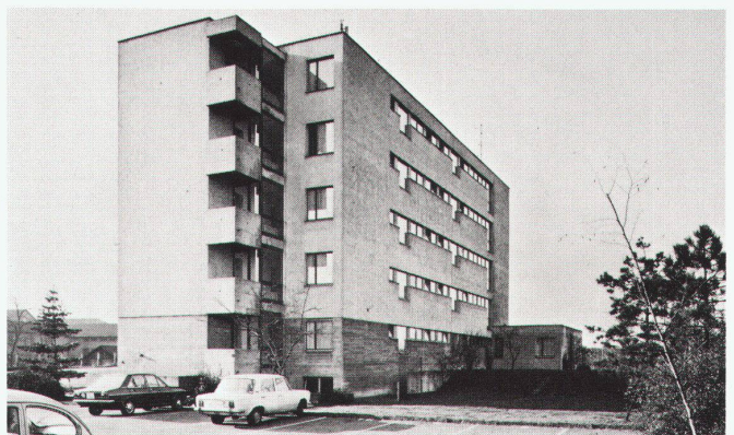
12 Ledigenheim Muttenz Grundriss und Ansicht