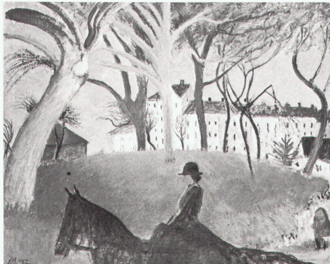
Ernst Morgenthaler, Vorstadt, 1922