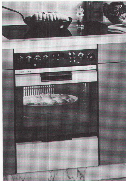
Einbaugerät SL 6

verhindert, dass es in der ganzen Wohnung nach Essen riecht und hält die angrenzenden Möbel kühl. Jetzt können Sie die umliegenden Tablare bedenkenlos für die Aufbewahrung von Lebensmitteln benutzen.