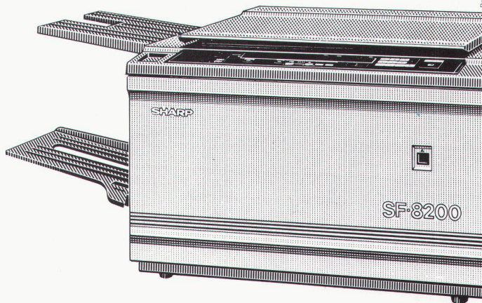
Bilder und Planung ESSV

Vergrössert stufenlos bis hinauf zu 141% der Originalgrösse!