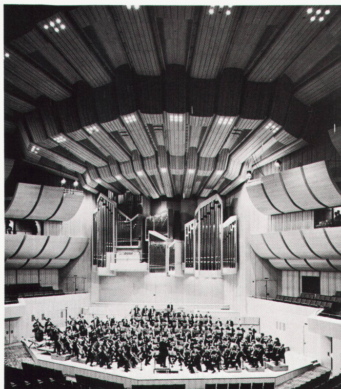
1 Der Philharmoniesaal des Kulturzentrums in München – perfekt in der Ausführung, optimale Klangverhältnisse.

Entwurf, Ausführungsplanung und künstlerische Oberleitung des Gesamtobjektes: Architektengemeinschaft Carl F. Raue, Eike Rolnhagen, Gerd Lindemann, Günter Grossmann und Mitarbeiter Lignoform Formsperrholz AG, 8717 Benken