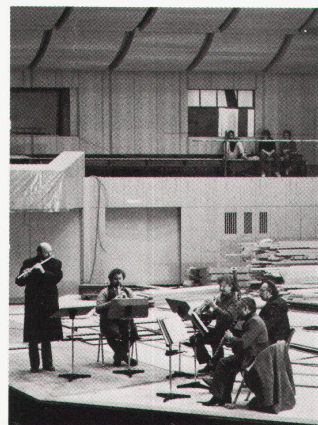
3 Erste Akustikprobe in der Philharmonie des Kulturzentrums in München im Bauzustand am 11.3.1985.