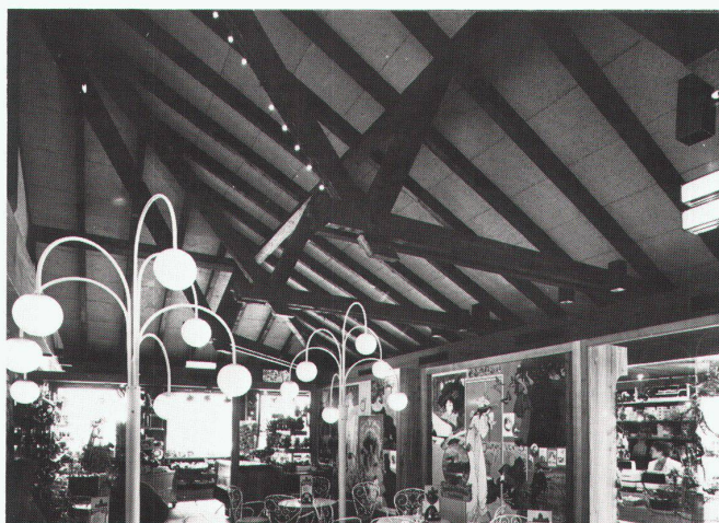
Autobahnrestaurant Mövenpick in Yverne-Aigle VD: 1200 m 2 Schichtex-Spezial 75/III, in Speziallängen, mit Längsfalz und Strukturanstrich, weiss gebrochen, auf Holzpfetten montiert.

Seit einem Jahr sind Floracron-Böschungsteine auf dem Schweizer Baumaterialienmarkt erhältlich. In dieser Zeitspanne haben sich diese Steine bereits bestens für Böschungssicherungen oder Terrassierungen mit Stützfunktion für mittlere Höhen bewährt. Die zweikammrigen Floracron-Steine bieten Gewähr für eine wirklich grüne Böschung und ermöglichen ein harmonisches Zusammenwirken von Fertigelement, Erdreich und Vegetation. Als weiteres Plus hat sich der Humus-