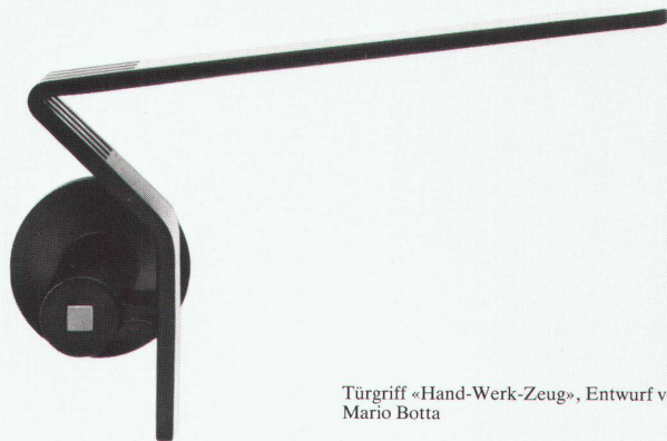
Türgriff «Hand-Werk-Zeug», Entwurf von Mario Botta