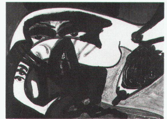
Martin Disler, Gravur

Martin Disler – Œuvre gravé 1978–1988 bis 3.9.