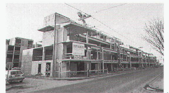
Wohnbebauung an der Brunnerstrasse,

Bei den Angaben zu den Pro- jektverfassern konnte der Eindruck entstehen, dass beide Wohnbebauun- gen von Helmut Richter und Heidulf Gerngross gemeinsam entworfen wurden (nur in der Legende wurden die Projektverfasser korrekt aufge- führt). Für die Wohnbebauung Gräf und Stift zeichneten Helmut Richter und Heidulf Gerngross gemeinsam, für die Wohnbebauung an der Brun- nerstrasse Helmut Richter.