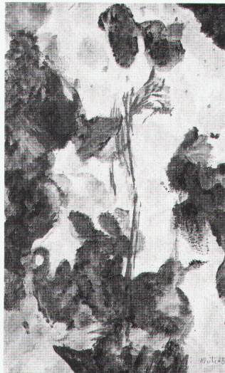
Max Weiler: Blaue Gewächse, 1988

Kunstmuseum Bern Lee Krasner – Jackson Pollock. Künstlerpaare – Künstlerfreunde bis 4.2.1990 Max Weiler – Malereien auf Papier bis 2.1.1990 Gegen den Strich – Bilder mit Ge- schichte von Daumier bis heute bis 7.1.1990 Cadavres exquis und andere Spiele bis 31.12.