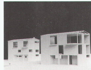
Atelierhaus Bill, 1932

Baukonstruktion der Moderne – Eine Analyse ausgewählter Schweizer Bauten bis 12.1.1990