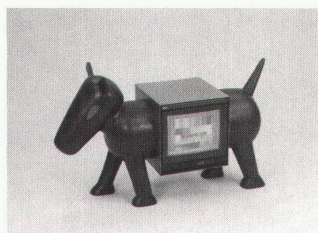
T.ier – V.ision

Im Rückenwind. Die StipendiatInnen des Eidgenössischen Stipendiums für angewandte Kunst 1990 bis 21.4.