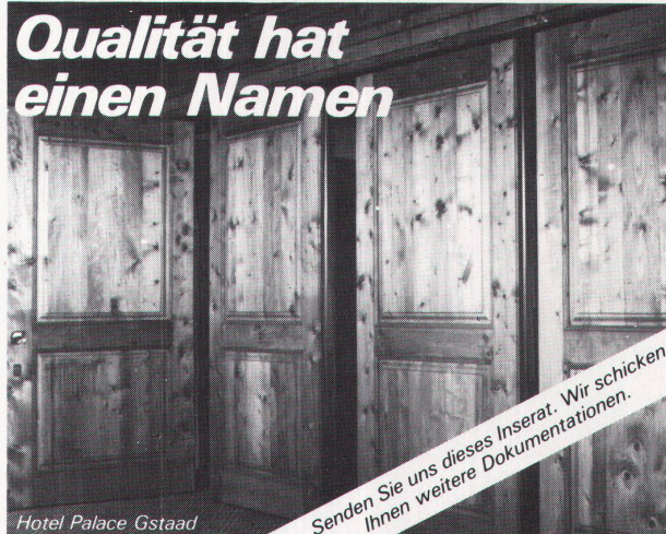
Hotel Palace Gstaad

Senden Sie uns dieses Inserat. Wir schicken Ihnen weitere Dokumentationen.