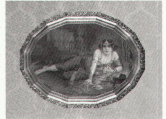
Dortmund, Salome, Farbdruck der Kunst- anstalt Wandsbek bei Hamburg, um 1925

Jeanne Mammen. Gemälde, Aqua- relle und Grafiken der Berliner Rea- listin bis 23.6.