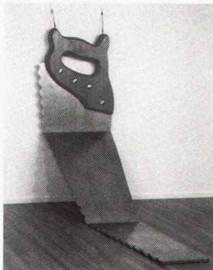
Claes Oldenburg. Saw (Hard Version), 1969