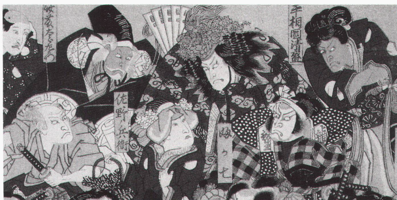
Steinau, Schloss: Utagawa Kunisada (1786–1865) «Theaterblatt, mit dem Schauspieler Nakamura Utaemon», um 1838

Weimar, Kunstsammlungen zu Weimar Die Metallwerkstatt am Bauhaus bis 27.9.