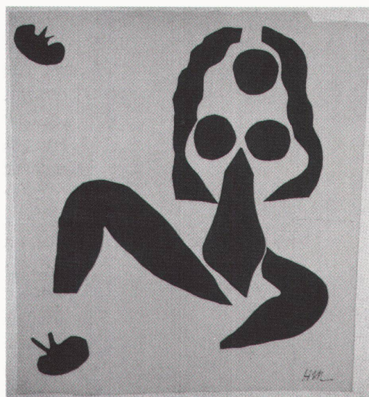
Basel, Kunstmuseum und Kunsthalle: Transform – Henri Matisse

Kassel, Ballhaus am Schloss Wilhelmshöhe Von Küste zu Küste: Präkolumbische Skulpturen aus Meso-Amerika bis 18.10.