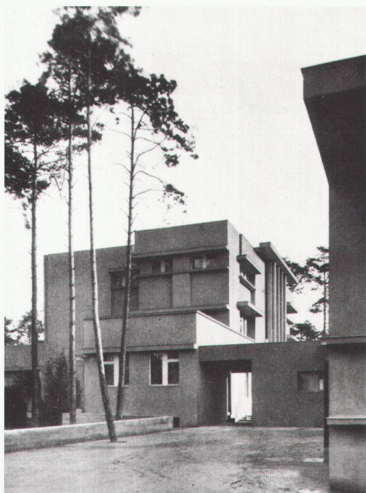
Haus der deutschen Turnerschaft, Berlin, Baujahr 1924