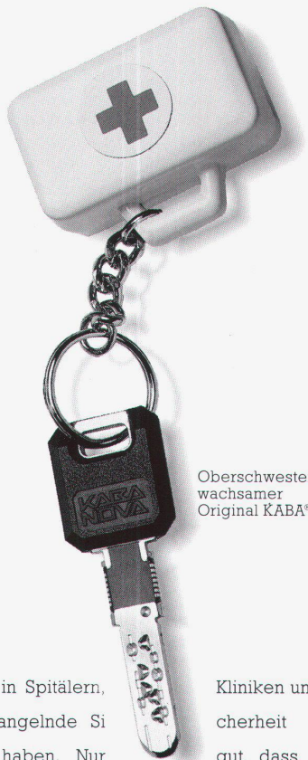
Oberschwester Silvias wachsamer Original KABA® NOVA.

Kontrolle eingeschlossen. Medikamente eingeschlossen.