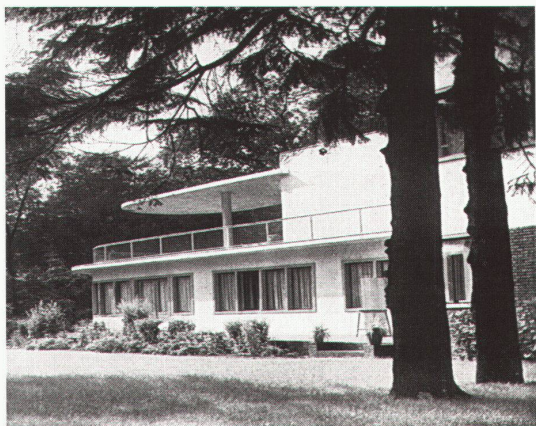
Landhaus des Kaufmanns Römer, die Gartenseite, Hamburg-Altona/Othmarschen, 1927; das Haus wurde in der Mitte des Baugrundstückes plaziert, um den vorhandenen Baumbestand zu schützen. Im Erdgeschoss liegen die Hauptwohn- und Gesellschaftsräume nach Süden, Halle und Nebenräume nach Norden. Im 1. Obergeschoss sind die Wohnräume nach Süden und Osten hin orientiert. Das Haus erhielt einen weissen Edelputz mit gelben Blockzargenfenstern. Teile der Fassade sind mit dunkelblauen Klinkern abgesetzt.

Baugeländes, dort wo das terrassierte Grundstück in leichtem Schwung abfällt, ordnete er einen weit-ausgreifenden zweigeschossigen Baukörper an. Damit wird das Landhaus regelrecht in die Topographie des Baugeländes hineingearbeitet. Ein viergeschossiger Turm leitet über zu einer zweifach abgestuften Stützwand, die sich im rechten Winkel anschliesst. Der Turm wird gleichsam zum Gelenk zwischen dem Wohnhaus und der Stützwand. Da das Wohnhaus und die terrassierte Stützwand nahezu die gleiche Kubatur aufweisen und jeweils an ihren Endpunkten spitzbogig ausgeformt sind, verlängern sie die beiden Baukörper ins Unendliche und bilden mit der Natur eine Einheit. Dies Bauen mit der Natur, die Topographie des Baugeländes stets für die Architektur nutzend, durchzieht das Werk Karl Schneiders, wird zum Markenzeichen und zeigt, wie sensibel er seine Architektur zu formulieren versteht. So ist das Landhaus Michaelens das erste Landhaus, das ganz im Stil des Neuen Bauens errichtet wurde. In den folgenden Jahren, vor allem