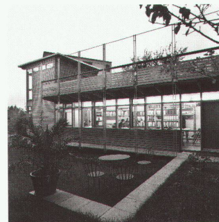
Maison familiale, Lausanne Architectes: Ueli Brauen, Doris Wälchli