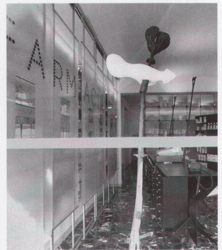
Veduta dello spazio di vendita, scultura di Paolo Selmoni Einblick Schaufenster-Offizin, Skulptur von Paolo Selmoni