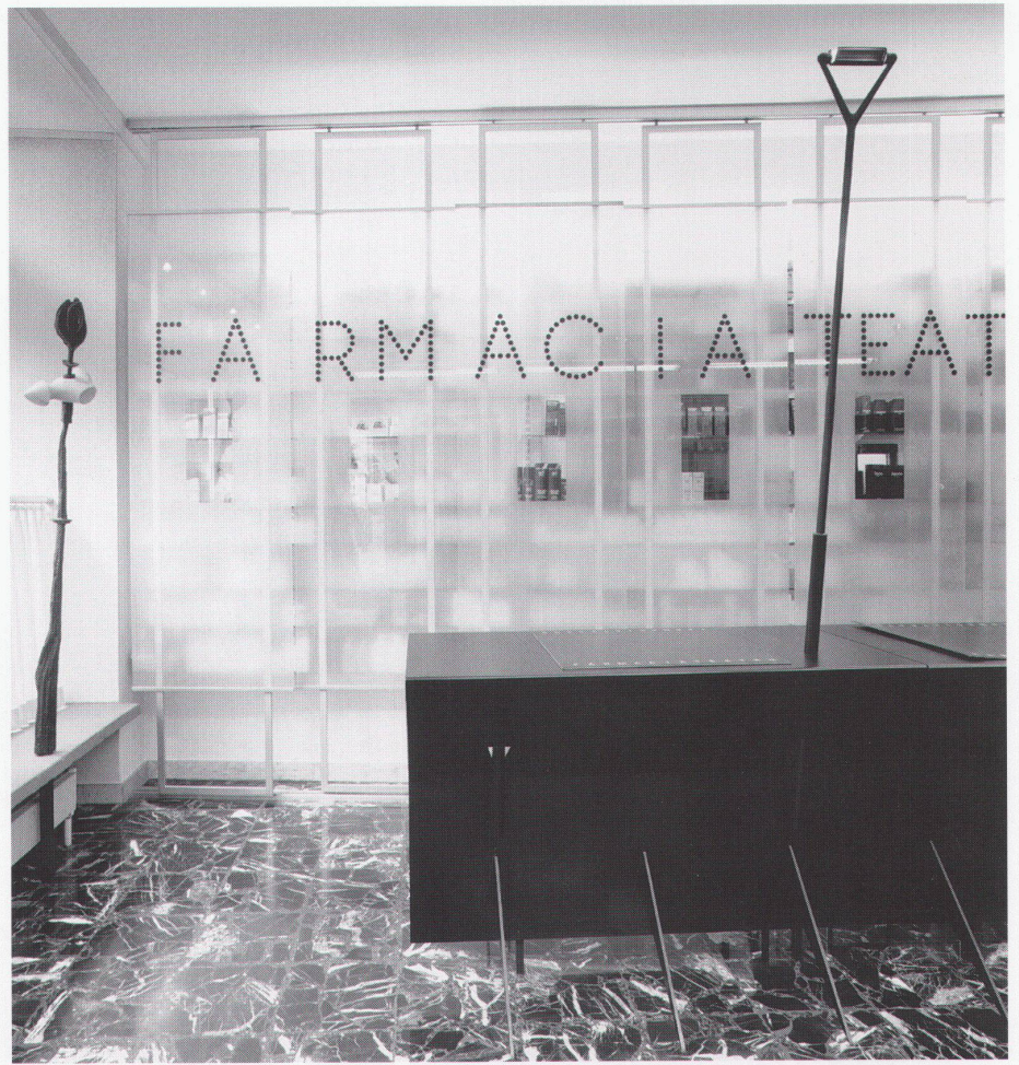
Spazio vendita Offizin