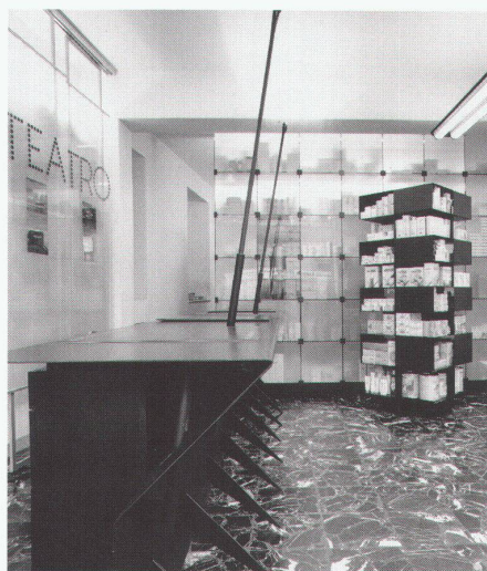
Dettaglio banco Verkaufstheke