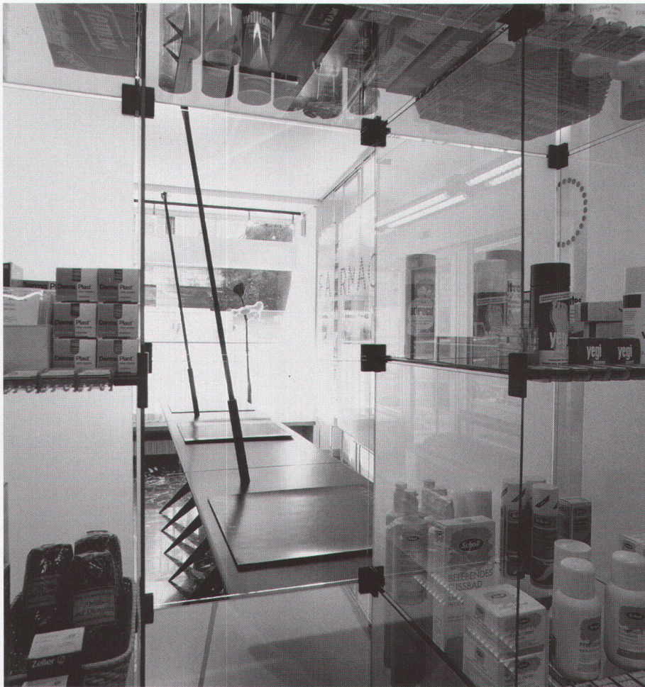
Veduta sul banco di vendita Einblick in Offizin