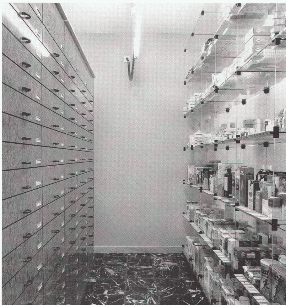
Spazio deposito Spezialitätenlager