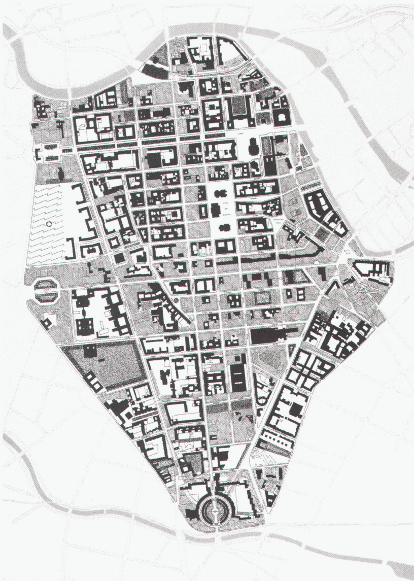
Übersichtsplan Dorotheen-/ Friedrichstadt, schwarz: vorhan- dener Baubestand; hellgrau: Reservoir der Bauflächen; dunkel- grau: Grünflächen

Für den Stadtentwicklungs-senator Volker Hassemer und für den Senator für Bau- und Wohnungswesen Wolfgang Nagel mag es ein ebenso spannendes Monopoly wie auch eine reale Herausforderung sein, den regen Kapitalfluss und seine Wirkung auf Berlins Mitte durchzuspielen. Eine Übersichtskarte aus dem Jahre 1991 zeigt, dass es die Kapitalanleger aus dem In- und Ausland in den ehemaligen Osten zieht: Von der Zimmerstrasse bis zum Bahnhof Friedrichstrasse reiht sich Block an Block zu einem riesigen Investitionsareal. Die Konkurrenz zweier Systeme ist damit beendet, die mit Hochhäusern an der Leipziger Strasse (Ost) und mit Prestigebauten an der Kochstrasse (West) den alten Stadtgrundriss zerstörte und dem Stadtzentrum seine Dichte nahm.