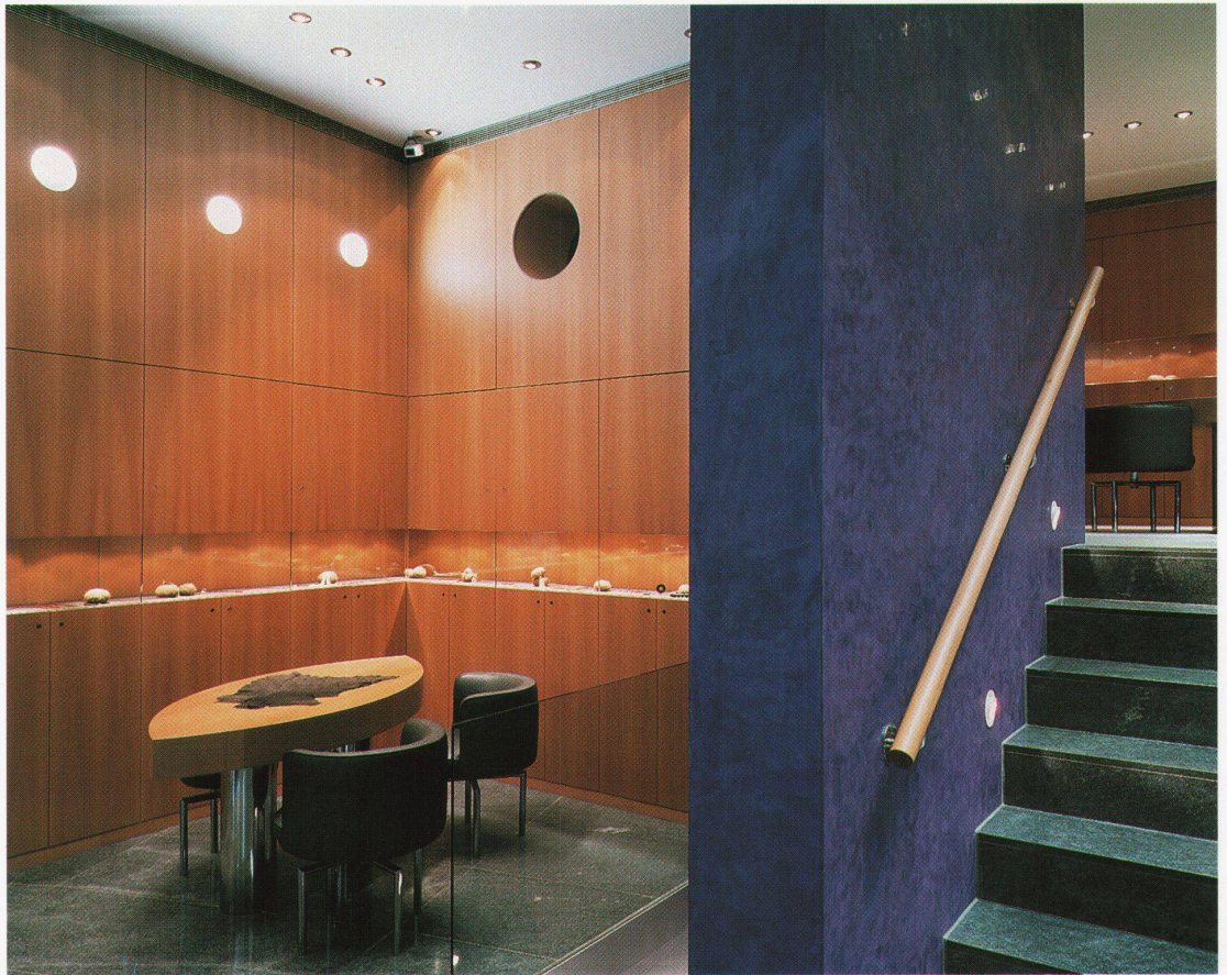
Beratungstisch Eingangsebene, Aufgang Zwischengeschoss Table de conseiller au niveau d'accès, montée vers l'étage intermédiaire

Die Liegenschaft Vadi-anstrasse 15 in St.Gallen, ein älteres Gebäude aus dem Jahre 1902, wurde renoviert und innen umstrukturiert. Im Erdgeschoss wurde die ehemalige Erschliessung von aussen aufgehoben und zwei spiegelbildlich gleiche Verkaufsräume geschaffen. In der linken Hälfte hat sich der Goldschmied Richard Lux vom Architektenpaar Trix und Robert Haussmann ein Goldschmiedegeschäft einrichten lassen. Auf engstem Raum, ca. 100 m 2 Nutzfläche, befinden sich auf vier Ebenen optimal verteilte Verkaufsräume, ein Büro, Werkstätten und Nebenräume.