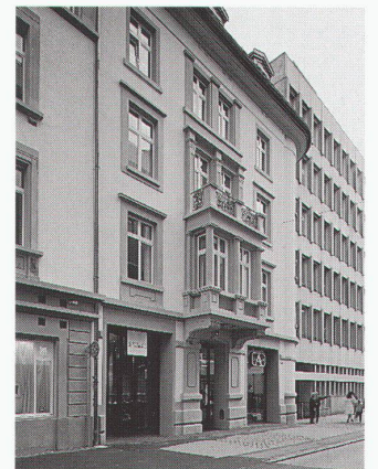
Fassade Vadianstrasse 15 Façade côté Vadianstrasse 15