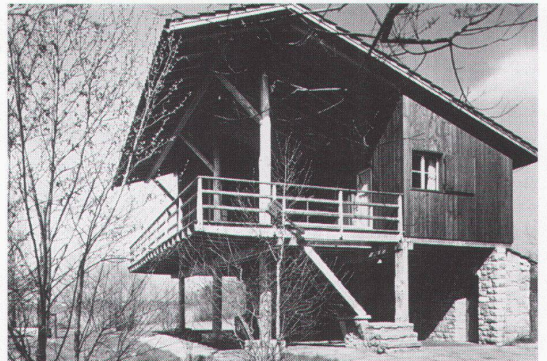
Ferienhaus Müller, Schenkon; Architekt G. Panozzo