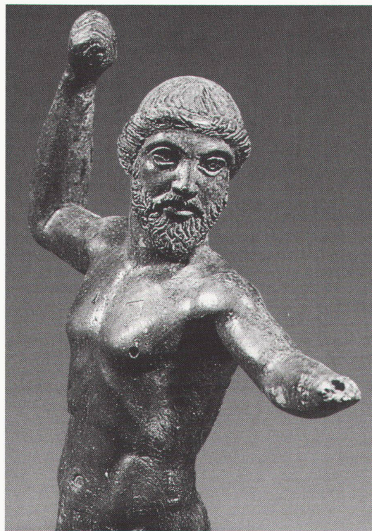
Chur, Rätisches Museum: Statuette des Zeus aus Apollonia, um 460 v.Chr., Bronze

Köln, Josef-Haubrich-Kunsthalle Anton Räderscheidt (1892-1970). Retrospektive bis 29.8. Renate Göbel. Chelsea People bis 22.8.