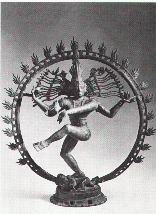
Zürich, Museum Rietberg: Tanzender Shiva (Nataraja), Bronze, Südindien, 11. Jh.

Genève, Musée d'art et d'histoire Bleus d'Egypte: De la pein- ture à la céramique au temps des pharaons bis 19.9.