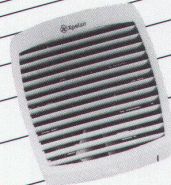
Fenster- und Wandventilatoren