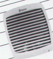
Fenster- und Wandventilatoren