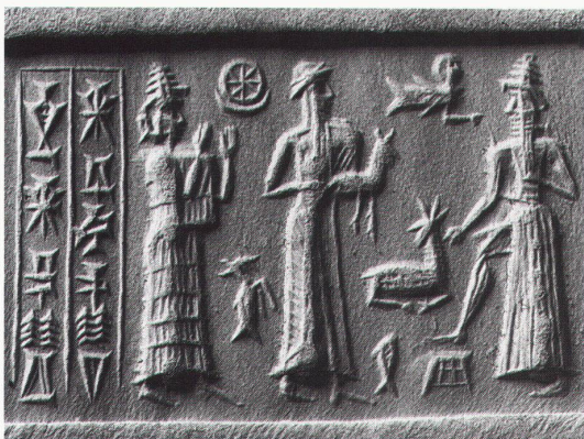
Karlsruhe, Badisches Landesmuseum: Rollsiegel aus der frühen Epoche an Euphrat und Tigris

Hannover, Sprengel-Museum Carl Fredrik Reuterswärd. Retrospektive bis 30.1.1994