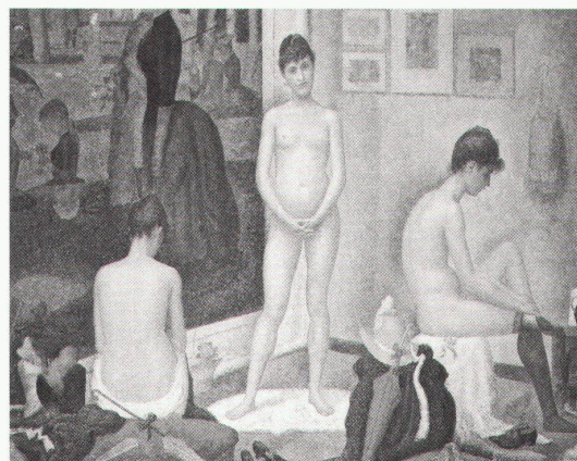
Paris, Musée d'Orsay: Seurat, Poseuses, 1886–1888

München, Staatliche Graphische Sammlung Neue Pinakothek Barry Le Va: Munich Diary African Sketchbook bis 9.1.1994