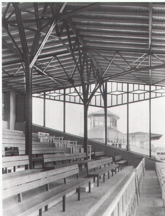
Krefeld, Kaiser-Wilhelm-Museum: August Endell, Berlin-Mariendorf, Trabrennbahn, 1911/12

Zürich, Schweizerisches Landesmuseum Reise ins Zentrum der Zeit bis 2.1.1994