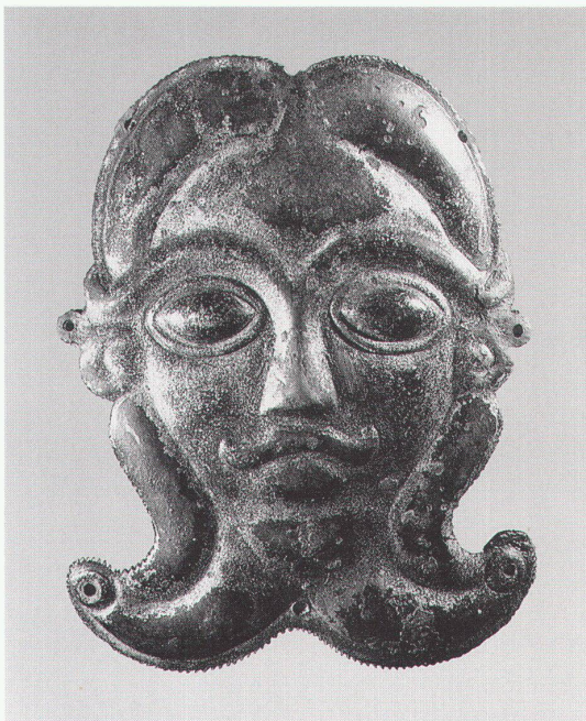
Chur, Rätisches Museum: Bronzemaske, Zierbeschlag einer Holzkanne aus einem keltischen Kriegergrab, 5. Jh. v. Chr.

Genova, Palazzo Ducale Sardegna: Civiltà di un'isola mediterranea bis 15.2.