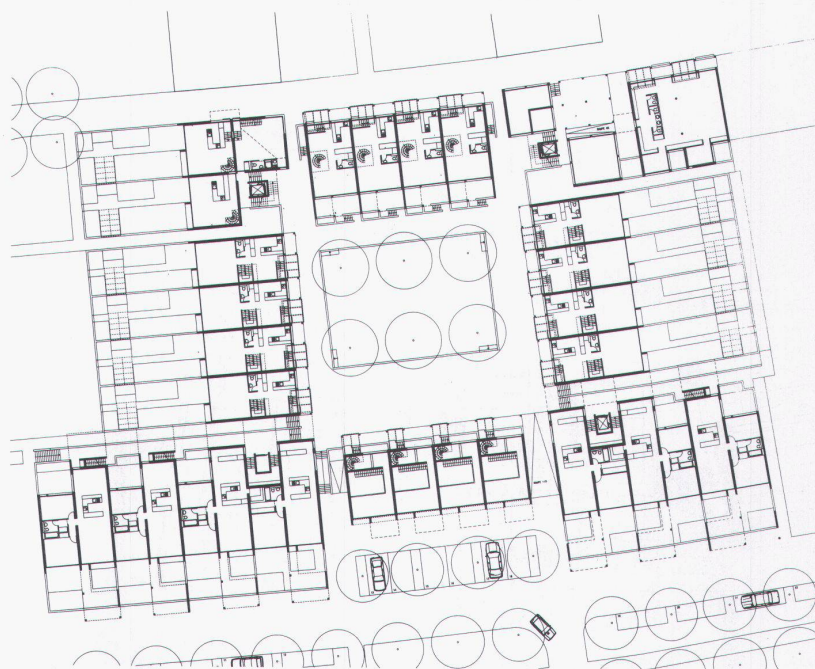
Ebene 1 Niveau 1 Level 1

■ Bodenacker housing scheme, Bremgarten by Berne, project 1987 The residential area situated on a plateau bordered by a steep slope is interspersed by clearly delimited, basically car-free public spaces and is defined by three utilisation levels: 1. living and business areas (noise-protection for the apartments to the rear) along Kalchackerstrasse; 2. communal premises along the central axis; and 3. recreation and leisure areas which are located along the bottom of the slope and extend into the residential area. The buildings are organised in rows of two- and three-storey living units and above them single-storey apartments. The projected structure of the houses, each with the option of its own access to almost every axis, facilitates subdivision of the site into various plots of land and freehold apartments. Construction of the development is planned over two to three stages.