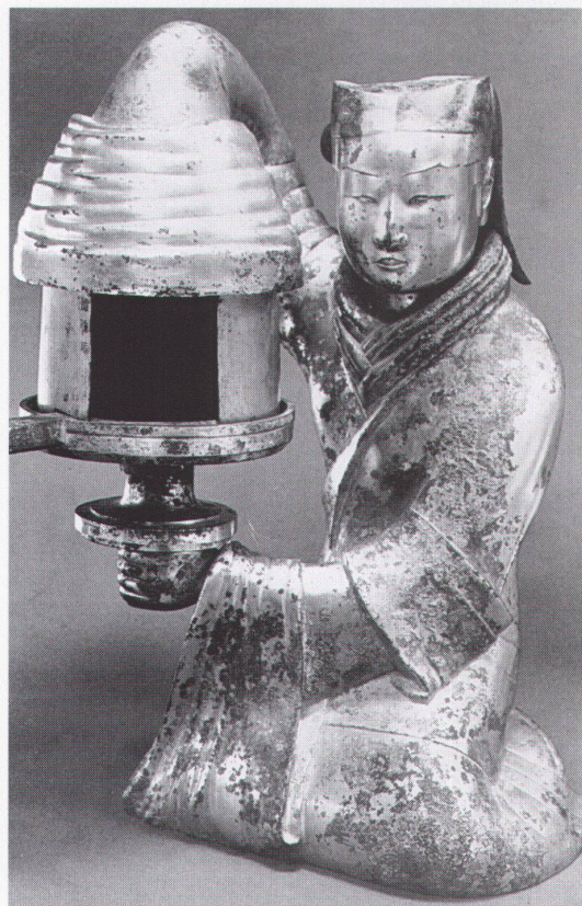
Hildesheim, Roemer- & Pelizaeus-Museum: Dienerin mit Lampe, Bronze, vergoldet

Firenze, Casa Buonarroti Michelangelo nell'Ottocento bis 31.10.