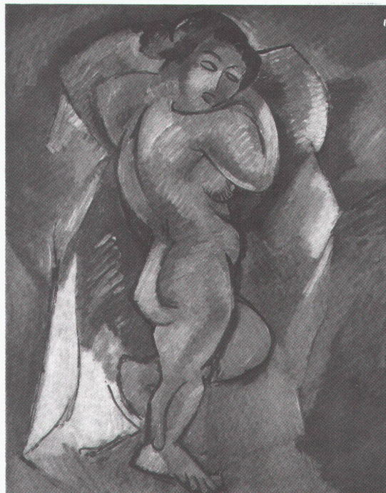
Saint-Paul, Fondation Maeght: Georges Braque, Grand Nu, 1908