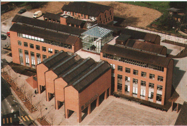
Stadthaus Dietikon, Architekten Guyer & Guyer

Ausstellungshallen Allmend Öffnungszeiten 9-18 Uhr