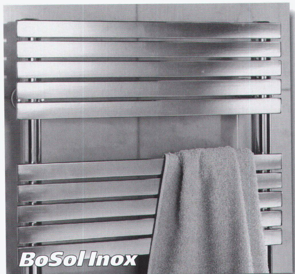
BoSol Inox in poliertem Chromstahl. Eines von 4 Modellen aus der neuen Badheizkörper-Linie von Borer.

Denken Sie jetzt nicht, dass der günstige Preis auf Kosten der Qualität geht. Im Gegenteil. Der Heizkörper ist so perfekt verarbeitet, dass Sie nirgends eine Schweißnaht finden. Natürlich kann er über das Zentralheizungsnetz, mit Elektroheizstab oder kombiniert betrieben werden. Dabei ist er so montagefreundlich, dass auch der Installateur seine Freude daran hat.